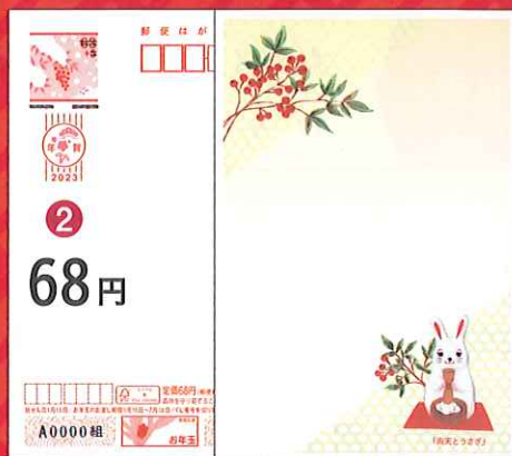
② 絵入り[寄付金付]全国版「南天とうさぎ」 *寄付金額は1枚につき5円です。