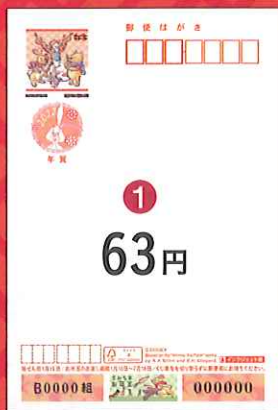
① ディズニー 年賀(インクジェット紙) *うら面は無地です。